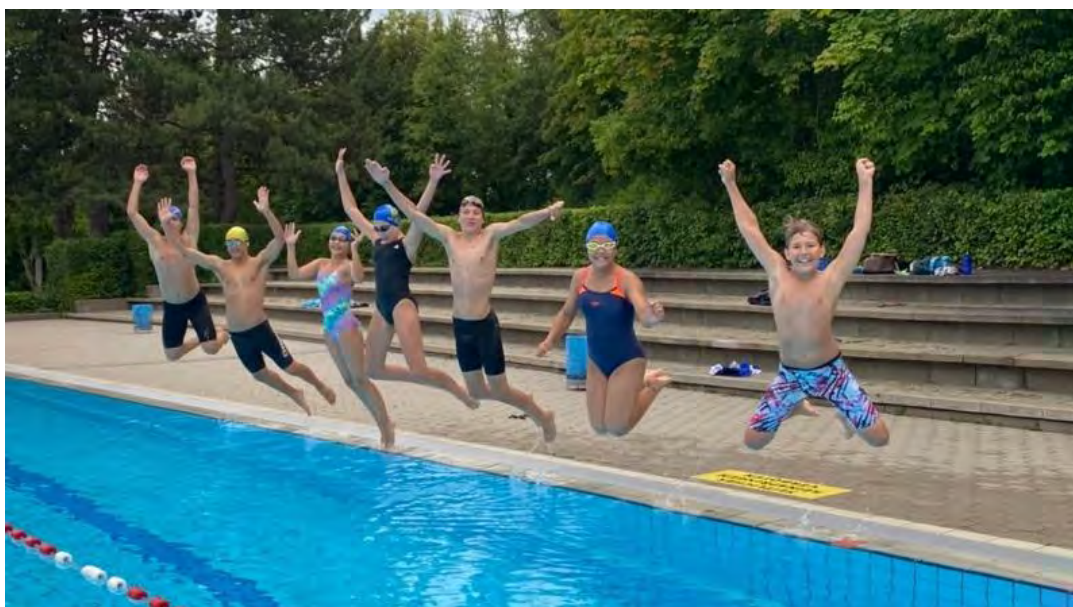
Spaß beim Training ;)